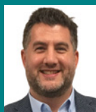
François Boucher Les Entreprises de réfrigération L.S.