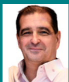
Michel Chagnon Réfrigération Actair