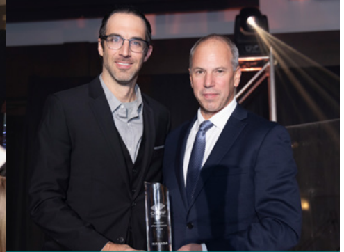
Chantier d'importance – NAVADA , pour le projet Espace Montmorency à Laval